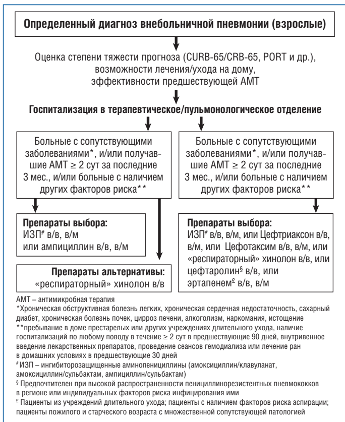
Рис. 3. Алгоритм выбора эмпирической антимикробной терапии нетяжелой ВП (госпитализированные пациенты) [1]

клавуланат и др.), цефалоспорины 3-го поколения, «респираторные» фторхинолоны, у отдельных категорий пациентов могут применяться цефтаролин и эртапенем. Рутинное назначение комбинации β-лактама + макролида per os при нетяжелой ВП в стационаре исходя из современных данных нецелесообразно [1].